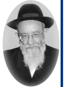
הרה"ג יוסף קאפח שליט"א